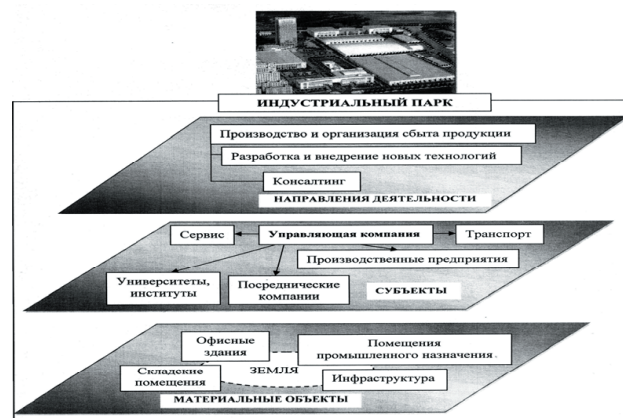
Рис. 2. Системное представление индустриального парка

- система организации работы парка, в том числе предоставление различных видов услуг компаниям-участникам индустриального парка.