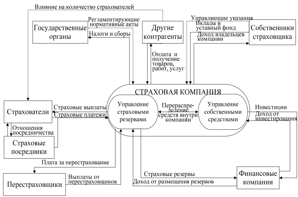
Рис. 2. Контрагенты страховщика и потоки, формирующие капитал страховой компании

Оставшиеся после окончания действия договора страхования и выплаты возмещений средства называются заработанной премией, которая переходит в собственность страховщика.