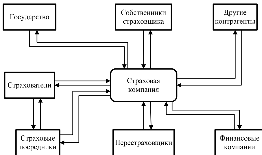
Рис. 1. Контрагенты страховой компании

Таким образом, очевидно, что среда деятельности страховщика содержит следующие группы контрагентов, которые показаны на рис. 1.