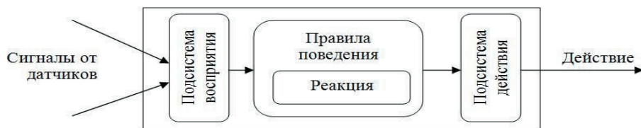
Рис. 1. Архитектура агента

Все сообщения, которыми обмениваются агенты, перехватываются и выводятся в окне объекта управ-