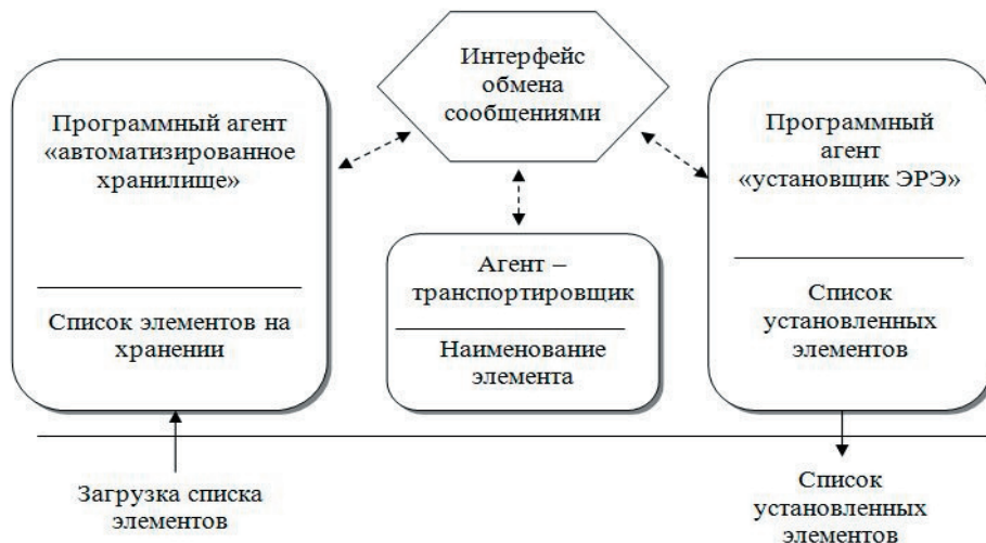
Рис. 2. Схема взаимодействия между агентами системы

ления для их последующего анализа и текущего контроля за ходом выполнения технологического процесса.