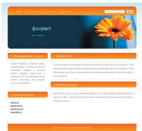
Рис. 5. Итоговый шаблон страницы сайта

Все шаблоны, которые предоставляет приложение, уже являются протестированными на возможные ошибки, развалы верстки и кроссбраузерность.