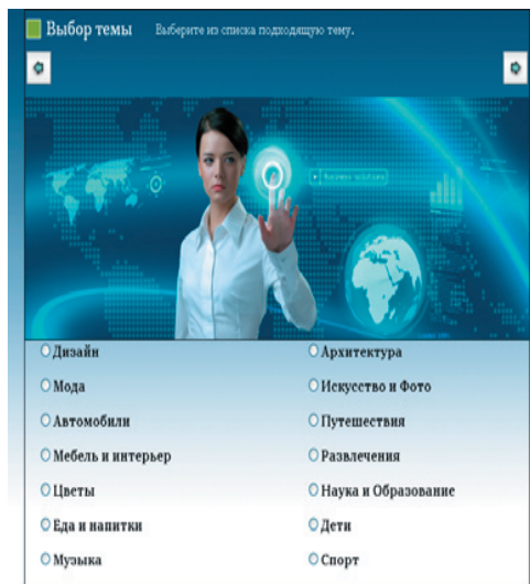
Рис. 2. Страница выбора темы сайта

брать тему сайта из предложенных вариантов. Такое разделение позволяет сгруппировать шаблоны по категориям и тем самым ускорить процесс выбора нужного шаблона.