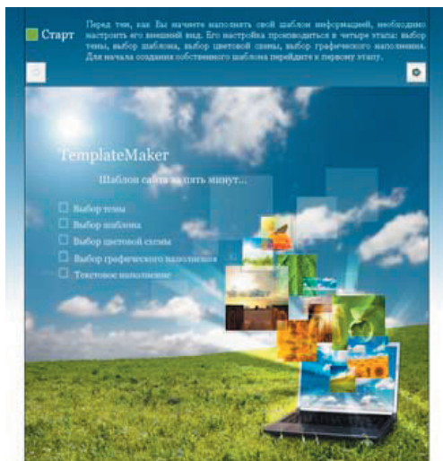
Рис. 1. Главная страница онлайн-приложения

Главная страница онлайн-приложения (рис. 1) содержит краткое описание самой программы с перечислением всех этапов, которые нужно пройти пользователю при создании сайта. Каждый шаг сопровождается подсказками и пояснениями вверху страницы.