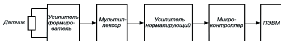
Рис. 1. Упрощённая структурная схема одного из каналов измерения

ИИСДК предназначена для измерения давления контактного взаимодействия между культеприёмной гильзой протеза и культёй. Упрощённая структурная схема одного из каналов измерения приведена на рис. 1.