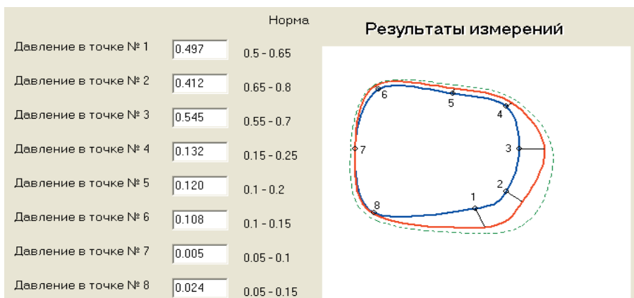
Рис. 4. Результат обработки данных о давлении в гильзе протеза бедра после оптимизации на уровне посадочного кольца

2. Разработанная методика оценки распределения