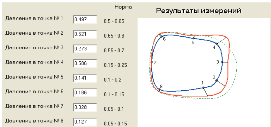
Рис. 3. Результат обработки данных о давлении в гильзе протеза бедра до оптимизации давления на уровне посадочного кольца

ностей костно-мышечного аппарата. Из рис. 3 видно, что давление в точке №4 (сухожилие длинной приводящей мышцы) значительно превышает норму, вызывая дискомфорт у пациента (подтвердилось опросом пациента), это свидетельствует о плохой подгонке гильзы. В результате проведенной коррекции формы гильзы (см. рис. 4) давление по всему периметру гильзы распределилось равномерно, без превышения величин условной нормы давления. При пользовании протезом у пациента не возникает болевых ощущений.