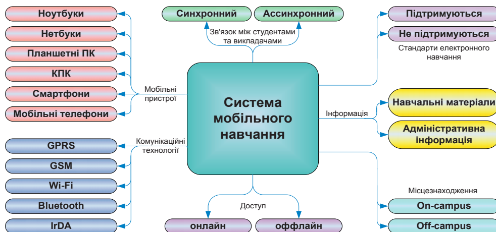
Рис. 2. Загальна класифікація систем мобільного навчання

У залежності від часу, коли викладачі і студенти обмінюються інформацією один з одним, системи мобільного навчання можуть бути класифіковані наступним чином: