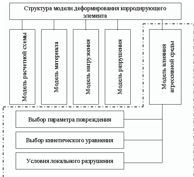
Рис. 2. Структура модели деформирования корродирующей пластины

1) Модель расчетной схемы рассматривается в рамках плоской задачи теории упругости [5]. Уравнения теории упругости отражают предположение, что условия равновесия формируются для недеформированного тела. Перемещения и деформации бесконечно малы, а связь между напряжениями и относительными деформациями линейна. Соотношения между напряжениями и поверхностными или объемными силами, перемещениями и относительными деформациями в совокупности представляют собой замкнутую систему уравнений, однозначно определяющую все компоненты напряжений, относительных деформаций и перемещений.