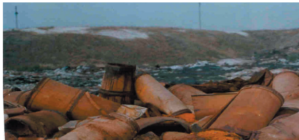
Рис. 2. Полігон промислових відходів ВАТ «Краситель»

Площа сольового забруднення в зоні впливу накопичувача підприємства у останні роки не змінюється і складає 0,13 км 2 , найбільша концентрація солей складає 3,0г/л, а загальна жорсткість 23,76 ммоль/л. Вміст сульфатів перевищує ГДК у 2-2,5 рази. Крім того відмічається підвищений вміст марганцю та літію. Існуюча мережа спостережних свердловин підприємства не вдосконалена і потребує ремонту.