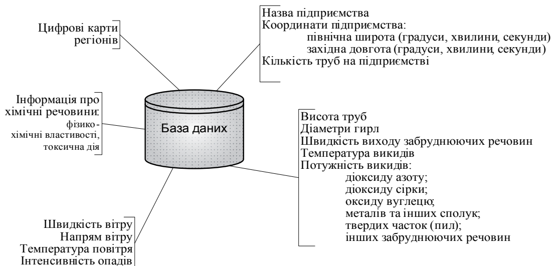
Рис. 2. Структура бази даних ІПКС