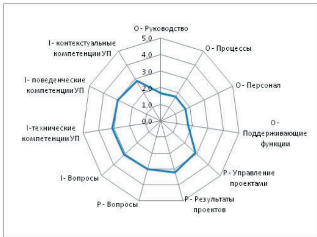
Рис. 5. Графическое отображение усредненных результатов оценки