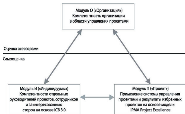
Рис. 1. Модель IPMA delta оценки организаций (модули И, П, О)

Модуль О используется ассессорами в качестве перечня вопросов и руководства для общения в рамках оценки совершенства. Этот модуль предусматривает обширный опрос, выполняемый непосредственно ассессорами при посещении организации. Вопросы модуля О охватывают широкий круг тем в контексте организации, начиная с управления, процессов и персонала и заканчивая средой (рис. 2).