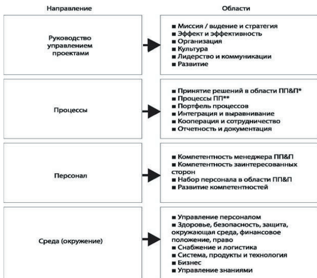
Рис. 2. Направления и области, оцениваемые по модулю О

При посещении организации ассессорами, для оценки совершенства проводятся интервью среди различных групп персонала (топ-менеджмент, руководители проектов и сотрудники), чтобы собрать максимально точные сведения о реальном состоянии организации в области управления проектами. Результаты оценки совершенства фиксируются в подробном отчете с рекомендациями. Организации присваивается класс (уровень) согласно пятиступенчатой системе классификации (рис. 3). Ей выдается соответствующий сертификат, который следует подтверждать каждые три года.