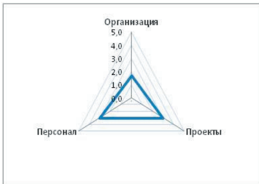
Рис. 6. Графическое отображение интегрированных результатов оценки

Итоговая оценка класса совершенства организации составила - 2,37 и организации был выдан сертификат 2 класса совершенства.