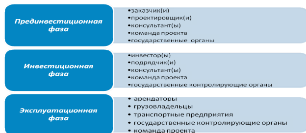
Рис. 3. Участники проекта создания МЛК

Наличие такого числа участников, а также динамичность их состава требуют их интеграции для получения результатов проекта и достижения как общих, так и локальных целей.