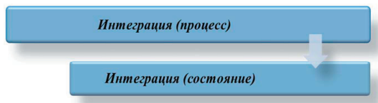
Рис. 1. Взаимосвязь между понятиями «интеграция»

В проектах создания МЛК интеграция проявляется в нескольких разновидностях (рис. 2):