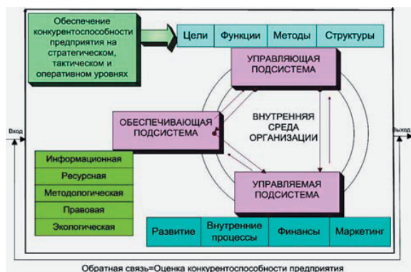
Рис. 2. Система управления конкурентоспособностью предприятия

Управляющая подсистема состоит из элементов определения целей, функций, методов и структуры управления конкурентоспособностью предприятия.