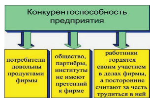
Рис. 1. Признаки конкурентоспособности предприятия

Конкурентоспособность предприятия определяется следующими признаками (рис. 1):