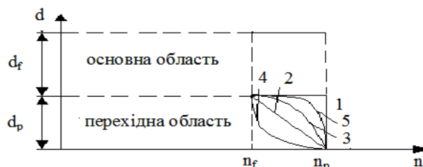
Рис. 1. Модель частково неоднорідної плівки (розподілу показника заломлення: 1 – ступінчастий; 2 – лінійний; 3 – квадратичний; 4 – логарифмічний; 5 – експоненціальний)

де n_{sp} – середнє значення показника заломлення в перехідному шарі відповідно; m – кількість розбиттів перехідного шару; k=2 – коли розглядається напівхвильовий шар і k=4 – коли розглядається четвертьхвильовий шар; n_f – показник заломлення основної частини плівки; \lambda_0 – робоча довжина хвилі.