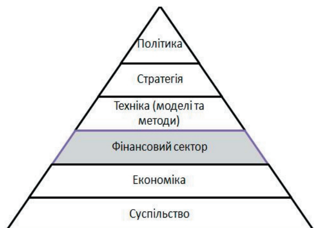
Рис. 1. Узагальнена модель ключових елементів багатовекторної методології управління розвитком фінансового сектору

Методологія базується на політиці розвитку фінансового сектору. На основі визначеної політики розвитку формується стратегія та інструменти її реалізації – моделі та методи. Фундаментом моделі є економіка та суспільство.