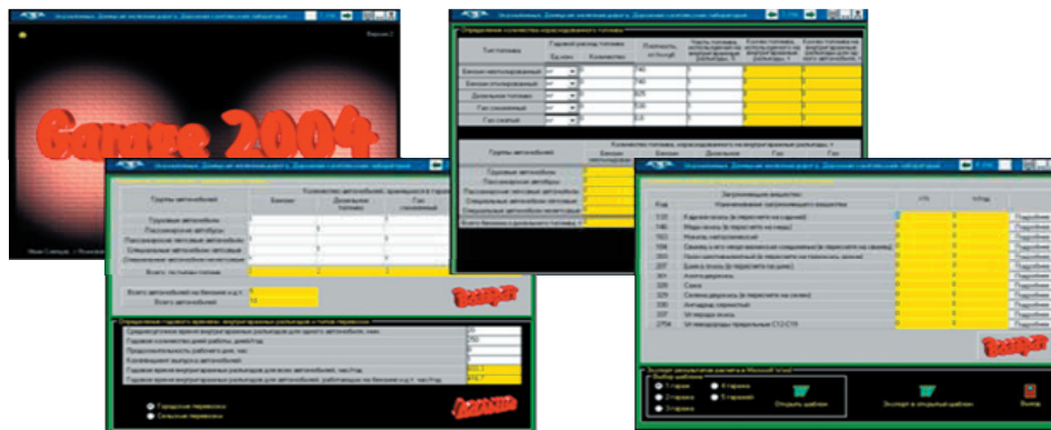
Рис. 1. Програма «Garage 2004» для розрахунку викидів забруднюючих речовин в атмосферу від парко-гаражних роз'їздів автомобілів

Серед низки простих та безкоштовних програмних засобів можна зазначити такі програми як «Garage 2004» (рис. 1) та «Атмосфера 2005», створених І.Б. Слепцовим (м. Ясиновата). «Garage 2004» дозволяє