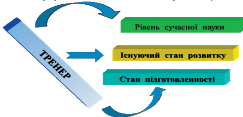
Рис. 1. Модельна концепція підготовки кваліфікованих гандболісток

лого змагального періоду макроциклу є актуальними у підготовці кваліфікованих гандболісток.