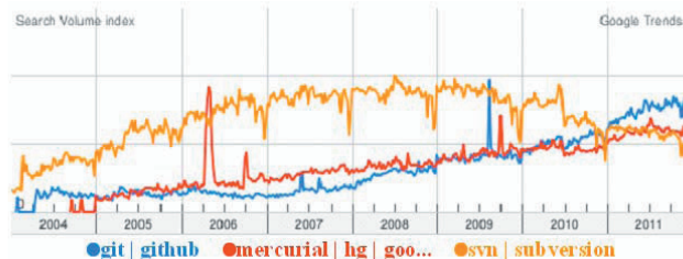
Рис. 1. Аналіз використання систем

Також у зв'язку з тим, що Subversion є централізованою системою, студенту при роботі буде потрібен постійно працюючий svn-сервер для синхронізації, що є дуже незручним. Тому вибір доцільно проводити між Mercurial та Git, як розподілених систем, шляхом порівняння за декількома критеріями та їх відповідності завданням, які пов'язані з навчальним процесом.