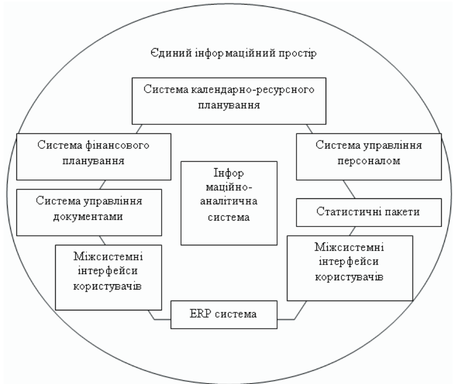
Рис. 2. Інтегрована система управління проектами : ERP – Enterprise Resource Planning (управління ресурсами організації)

велось укрупнено, була відсутня деталізація графіку робіт. Послідовність виконання і взаємозв'язок робіт, конкретні терміни та інтенсивність їх виконання встановлювалися безпосередньо на шкалі часу графіка, а далі спускались у вигляді тижнево-добових завдань. За такої схеми управління просто неможливо оперативно, об'єктивно та деталізовано працювати та приймати проектні рішення через те, що формування графіків потребує трудомісткого збирання, аналізу та обробки великих обсягів інформації. Продуктивність підготовчих робіт за таких умов невисока, а інформація про виконання робіт, необхідна для аналізу поточного стану проекту та застосування коригуючих дій, надходить раз на тиждень, а іноді й рідше. Відтак керівник, не чекаючи цих даних, приймає невідкладні управлінські рішення, спираючись лише на загальну оцінку ситуації і свій досвід, не завжди об'єктивно та реально оцінюючи фактичну ситуацію, що склалася на будівельному майданчику.