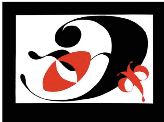
Рис. 3. Акцент на образ

Ту же задачу, следуя нашим принципам сочетания, можно решить проще. В выборе средств следует сохранять единство и помнить о том, что громче всего должны звучать слова, объединенные с рисунком. Так в следующем примере усиливается передача смысла фразы за счет геометризации букв (рис. 4).