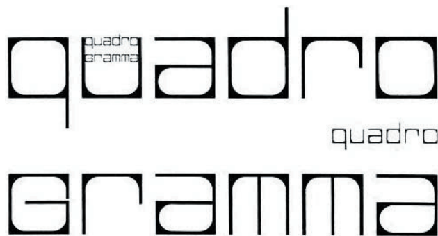
Рис. 4. Форма букв в виде квадрата