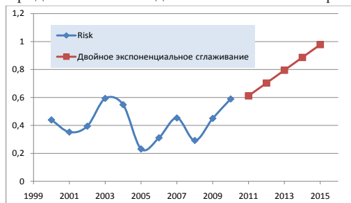
Рис.3. Прогнозування якісного стану річки Лопань методом Хольта на основі визначення динаміки зміни показника ризику здоров'ю населення при рекреаційному водокористуванні

За допомогою побудованого прогнозу можна побачити загальну тенденцію погіршення стану річок (рис. 3) і зробити висновок, що сучасний стан басейну річки Лопань потребує негайного впровадження природоохоронних заходів, бо до 2020 року очікується досягнення максимального значення ризику здоров'ю населення та продовження випадків масової загибелі риб.