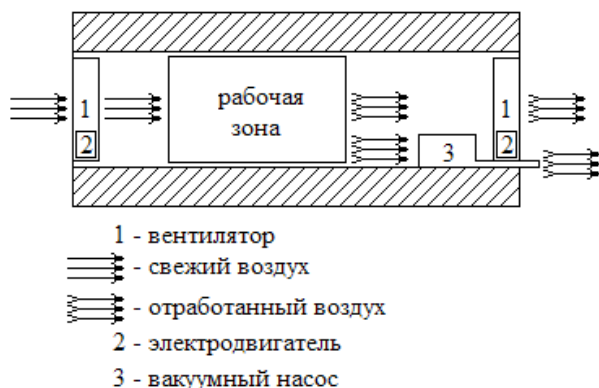
Рис. 2. Схема процесса проветривания забоя

Схема процесса проветривания рабочей зоны тупикового забоя представлена на рис. 2.