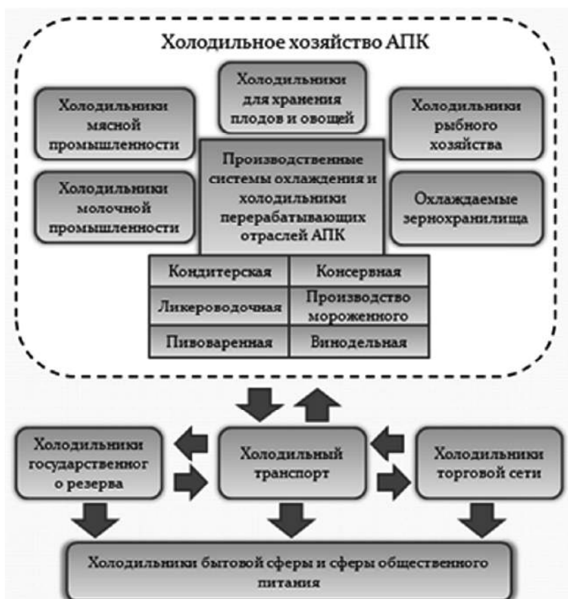
Рис. 1. Структура холодильного хозяйства агропромышленного комплекса

Однако большинство этих технологий отличаются узкой специализацией, связанной с видом и назначением продукции, и поэтому не могут быть использованы как универсальный вариант для всех видов продукции. Поэтому во всех странах мира наибольшее применение находит холодильная технология, заключающаяся в воздействии на продукты пониженной температурой. Условная структура холодильного хозяйства агропромышленного комплекса показана на рис. 1.