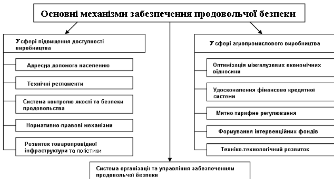
Рис. 1. Механізми забезпечення продовольчої безпеки

Показники продовольчої безпеки регіону можуть мати наступну систему: специфічні особливості регіону з точки зору можливостей розвитку і стану агропромислового виробництва та продовольчого ринку; рівень доходів населення і цін на продовольчі товари; рівень самозабезпечення (у тому числі і за рахунок особистих господарств населення); ступінь задоволення потреб населення в основних продуктах харчування з точки зору як раціонального, так і мінімального рівня споживання; розмір перехідних запасів продовольства [4].