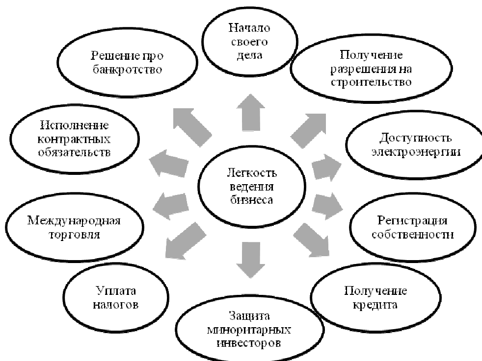
Рис. 1. Составляющие рейтинга «Легкость ведения бизнеса»

Сравнение рейтингов 2013 и 2014 годов показало общее ухудшение состояния в сфере ведения бизнеса в Украине (рис. 2).