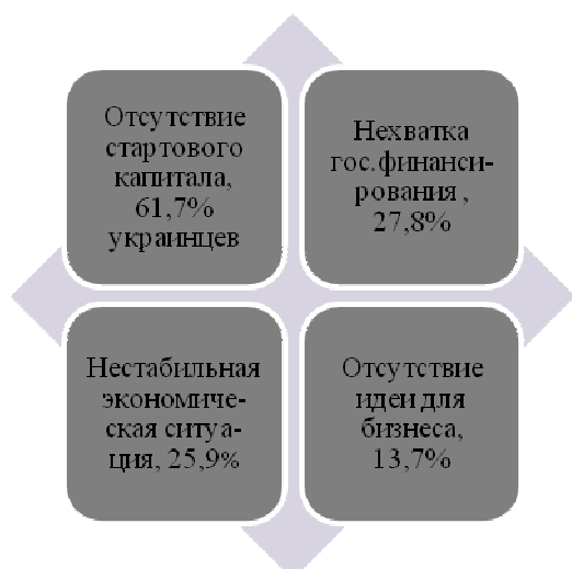
Рис. 4. Европа