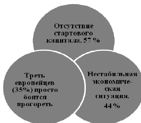
Рис. 3. Украина

4. Основные препятствия на пути к самозанятости. Как и предыдущий показатель, его следует анализировать в сравнении с Европой. На рис. 3 и