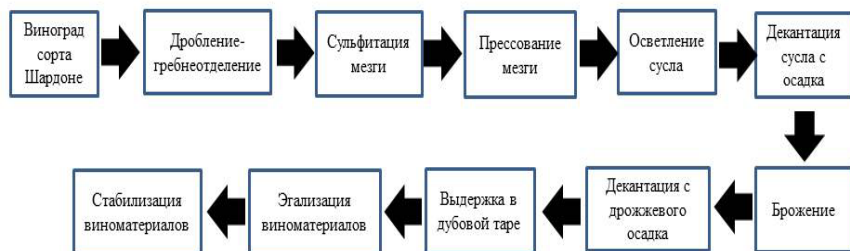
Рис. 1. Технологическая блок-схема производства вин категории КНП

Экспериментальные образцы были получены согласно технологической схеме, которая представлена на рис. 1.