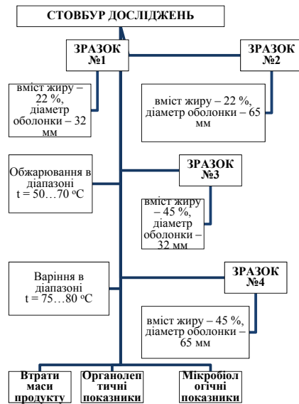
Рис. 1. Схема проведення досліджень оптимізації режимів термічного оброблення варених ковбас

У якості модельних зразків використали фарш сосисок «Молочні» з масовою часткою жиру 45 % та фарш вареної ковбаси «Докторська» з масовою часткою жиру 22 %. Контрольними зразками служили сосиски «Молочні» та варена ковбаса «Докторська», виготовлені відповідно до діючих технологічних інструкцій. Схема проведення досліджень показана на рис. 1.