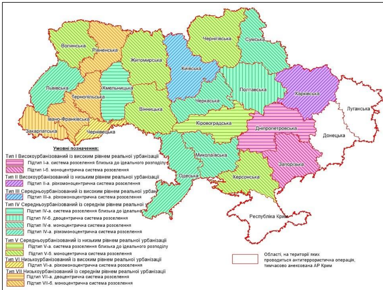
Рис. 3. Типізація регіональних урбанізаційних процесів в Україні, 2017 р. (складено за результатами дослідження)

Першому типу характерний високий рівень офіційної та реальної урбанізації. У ньому виділяємо два підтипи: I-а – система розселення близька до ідеального розподілу (Дніпропетровська