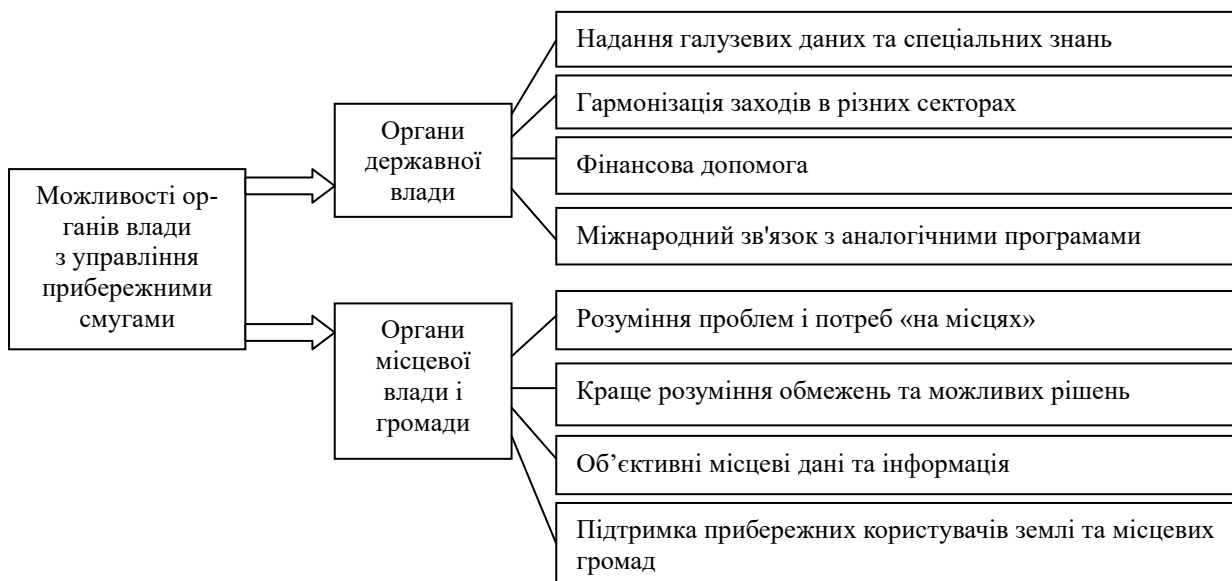
Рис. 2. Можливості державної та місцевої органів влади в галузі управління прибережними смугами