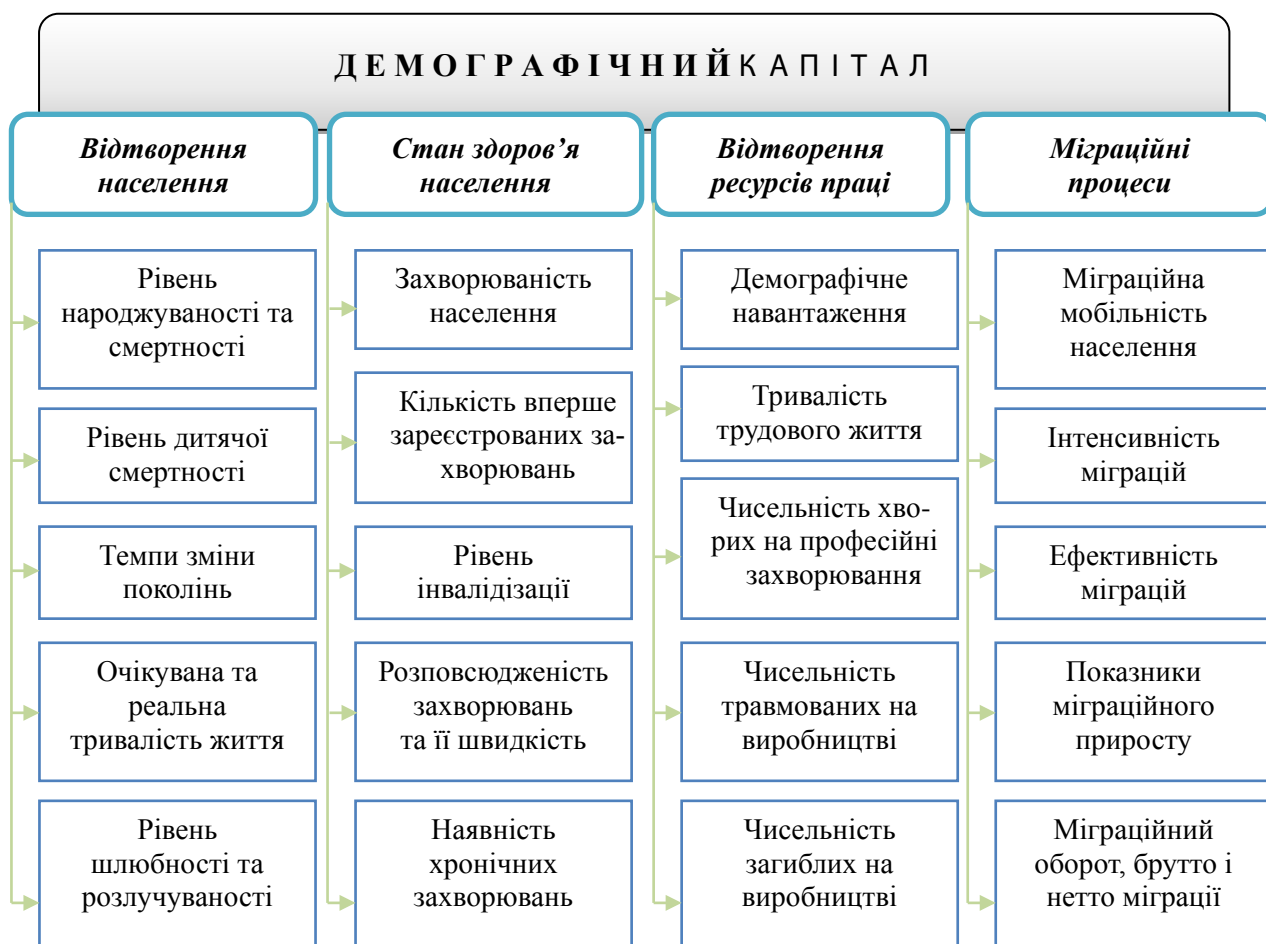
Рис. 1. Основні показники формування демографічного капіталу (узагальнено за [1, 2, 3, 8, 9]).

регіону, можна їх поділити на ті, які сприяють його формуванню (стимулятори) та ті, що є перешкодою його формуванню (дестимулятори). Виходячи із наявних статистичних даних Головного управління статистики в Харківській області [7], було відібрано 19 показників (10 – стимуляторів та 9 дестимуляторів) для визначення передумов формування демографічного капіталу по містам та районам Харківської області (таблиця 1).