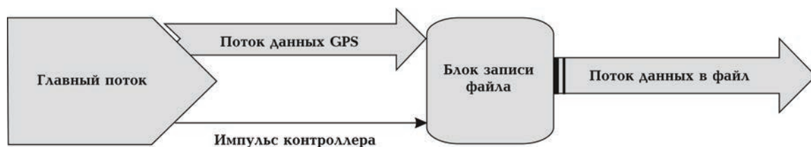
Рис. 2. Алгоритм программы сбора географических координат пунктов возбуждения упругих колебаний.

#include "boost/thread/thread.hpp" class GpsThread { /*Инициализация последовательного порта; */ /*Считывание данных с прибора GPS в стек; */ } oGps; class RflThread { /*Создание результирующего файла; */ } oRfl; int mParPin() { /*Инициализация параллельного порта; */ /*Цикл слежения за состоянием контакта 10 параллельного порта; */ } int main() { //создается поток, работающий с прибором GPS boost::thread MymGps(oGps); //создается поток, записывающий данные в результирующий файл boost::thread MymRfl(oRfl); //уступить порожденному потоку квант времени boost::thread::yield(); //главный поток слежения прихода импуль-