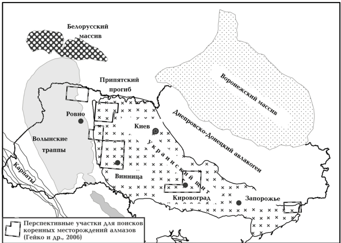
Рис. 3. Взаимное расположение траппов и перспективных для поиска коренных месторождений алмазов участков на Украинском щите, выделяемых по геолого-геофизическим данным.

сти генерации плюмов, расположенной над границей африканской и тихоокеанской областей пониженных скоростей поперечных волн на границе мантии и ядра. Это дополнительно подчеркивает, что гигантские мантийные плюмы возникают только в определенных условиях, существующих на границе долгоживущих и, видимо, отличающихся по составу от остальной мантии гигантских образований на границе мантии с ядром.