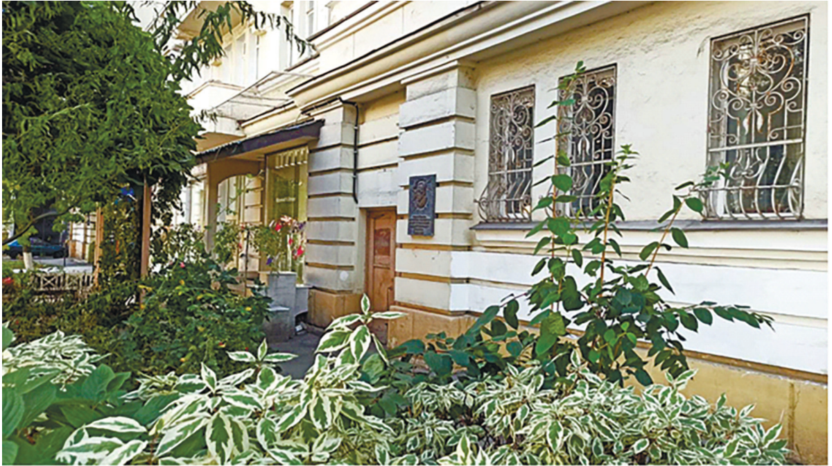
Фото 2. Під'їзд будинку № 15 по вулиці Гетьмана Павла Скоропадського, де встановлена меморіальна дошка пам'яті Анатолія Васильовича Чекунова.