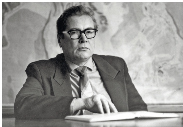
Фото 1. Чекунов Анатолій Васильович (1932—1996) — видатний український учений в галузі комплексного дослідження глибинної будови літосфери, доктор геолого-мінералогічних наук (1972), професор (1973), член-кореспондент (1973), академік АН УРСР (1979), лауреат Державної премії України в галузі науки і техніки (1984, 1995).

1 Тепер це вулиця Гетьмана Павла Скоропадського.