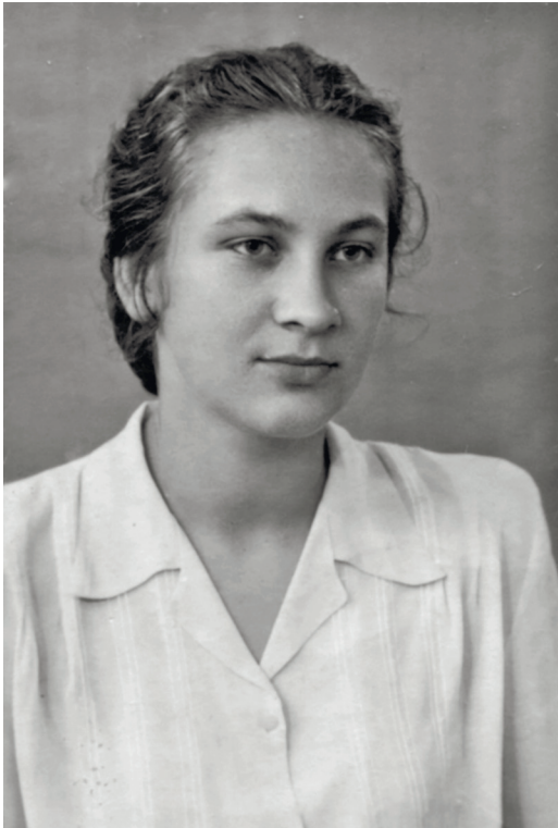
Фото 1. 15 червня 1952 р. Після закінчення десятиріччя.

Дивовижне Академмістечко! Скільки видатних вчених і просто чудових людей мешкало й досі мешкає в цих більш ніж скромних будинках! Скільки наприкінці 1960-х — на початку 1970-х років у нашій гостинці було написано дисертацій: хто де примудрявся це робити. Зрозуміло, що