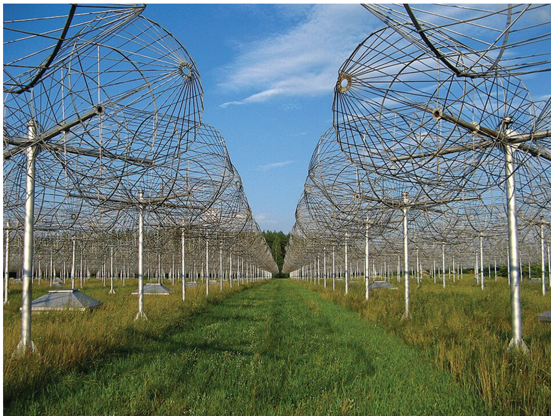
Фото 2. Антенне поле радіотелескопа УРАН-2 у с. Степанівка.

астрометричних методів, а також технологічних досягнень у супутниковій геодезії/GPS/GNSS-моніторингу цивільних споруд, обсерваторія проводить дослідження сучасних вертикальних рухів земної поверхні, наслідків руйнувань, спричинених як людиною, так і природою, а також радіоастрономічні дослідження фонового космічного випромінювання.