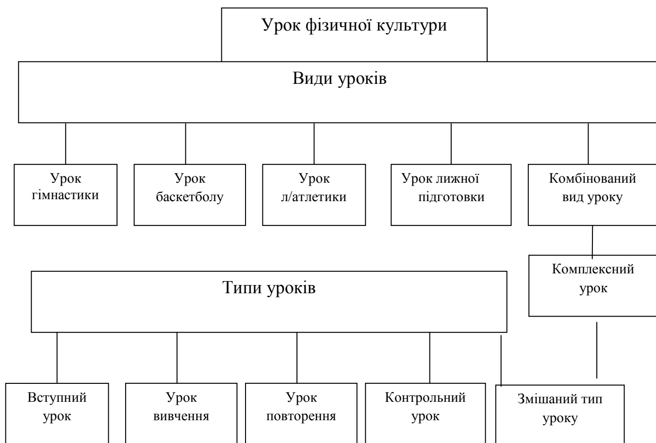
Рис.1. Класифікація уроків фізичної культури

На основі наведеної класифікації і з урахуванням функцій фізичного виховання по ступеням навчання ми можемо всю систему із більше ніж 1000 уроків розподілити на види і типи. Це дозволить визначити роль і місце кожного уроку фізичної культури в цій загальній системі і на підставі цього конкретизувати цілі і завдання кожного уроку.