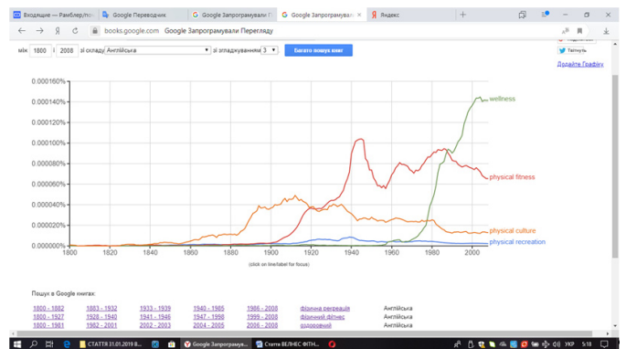
Рис. 1. Відносна частота використання термінів "physical recreation", "physical fitness", "wellness" та "physical culture" в англійських друкованих виданнях в період з 1800 року по 2008 рік (отримано з допомогою пошукової системи "Google Books Ngram Viewer" (режим доступу: https://books.google.com/ngrams ).

ся термін "physical culture". Зниження частоти його використання співпадає зі збільшенням частоти використання терміну "physical fitness". По-друге, використання термінів "physical recreation" та "physical fitness" почалося на рубежі 20-го сторіччя практично синхронно, однак темпи зростання частоти використання терміну "physical fitness" були суттєво вищі. По-третє, термін "wellness" став широко використовуватись в друкованих виданнях, а відповідно і вживатись в англійській практиці, лише наприкінці 60-х років минулого сторіччя.