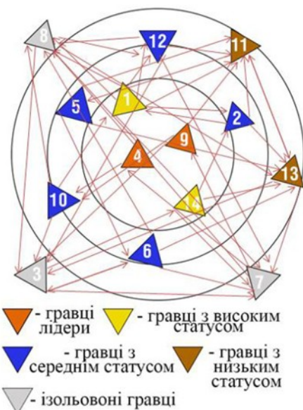
Рис. 2. Динаміка міжособистісних відносин в групі (антипатія)

З рисунку 2 бачимо, що найбільшу суму балів і число негативних відгуків у 3 гравця. Гравці 5, 6 і 7 також мають високий бал. Спортсмени 1, 4, 8, 12, 13 теж отримали на