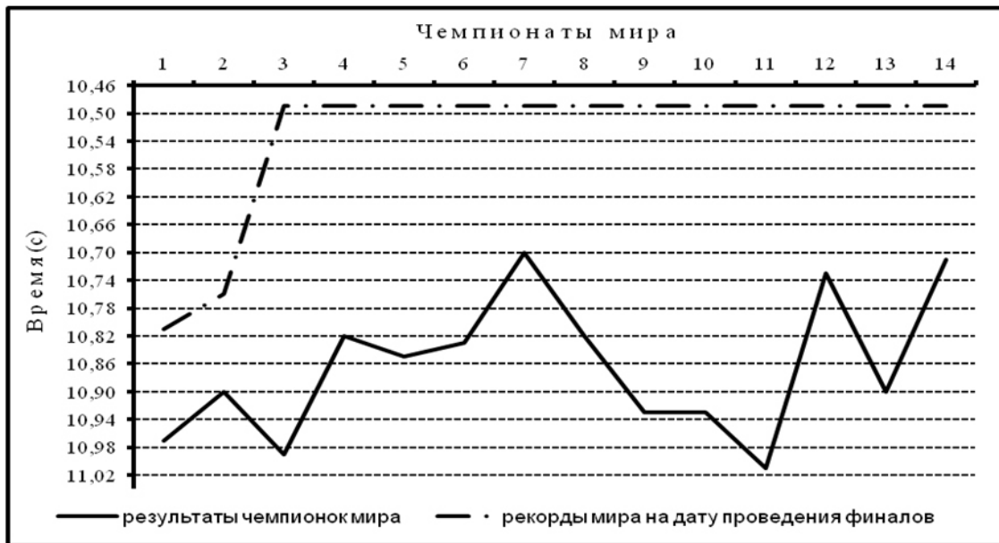
Рис. 3. Сравнительная динамика результатов победительниц чемпионатов мира с действующими рекордами мира в беге на 100 м

Перспективы дальнейших исследований в данном направлении. В дальнейшем аналогичные исследования планируется провести по всем дисциплинам лёгкой атлетики, входящим в группу спринтерского и барьерного бега (первичные данные собраны и обработаны).