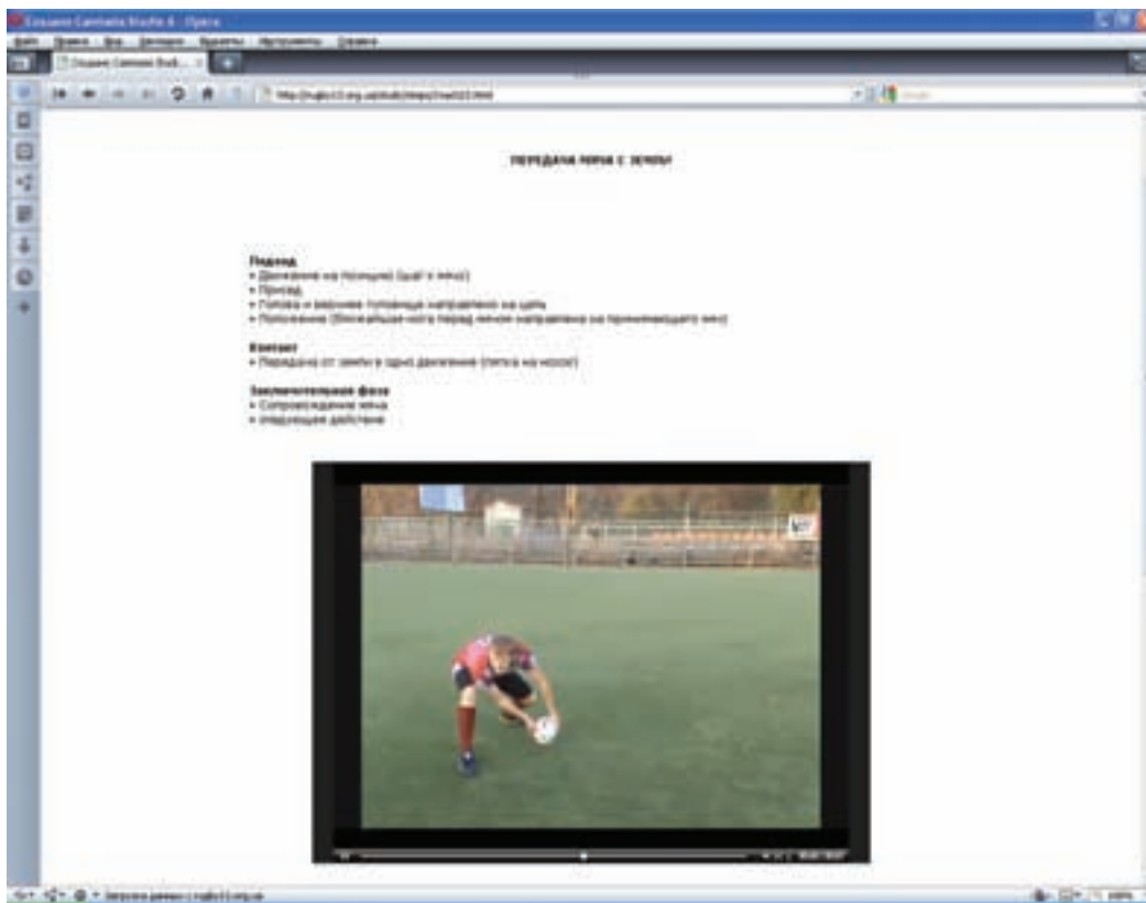
Рис. 6. Робоче вікно (передача м'яча з землі)

Перспективи подальших досліджень полягають у впровадженні навчальної комп'ютерної програми «Регбі-13» в навчально-тренувальний процес з регбіліг з метою підвищення його якості та ефективності.