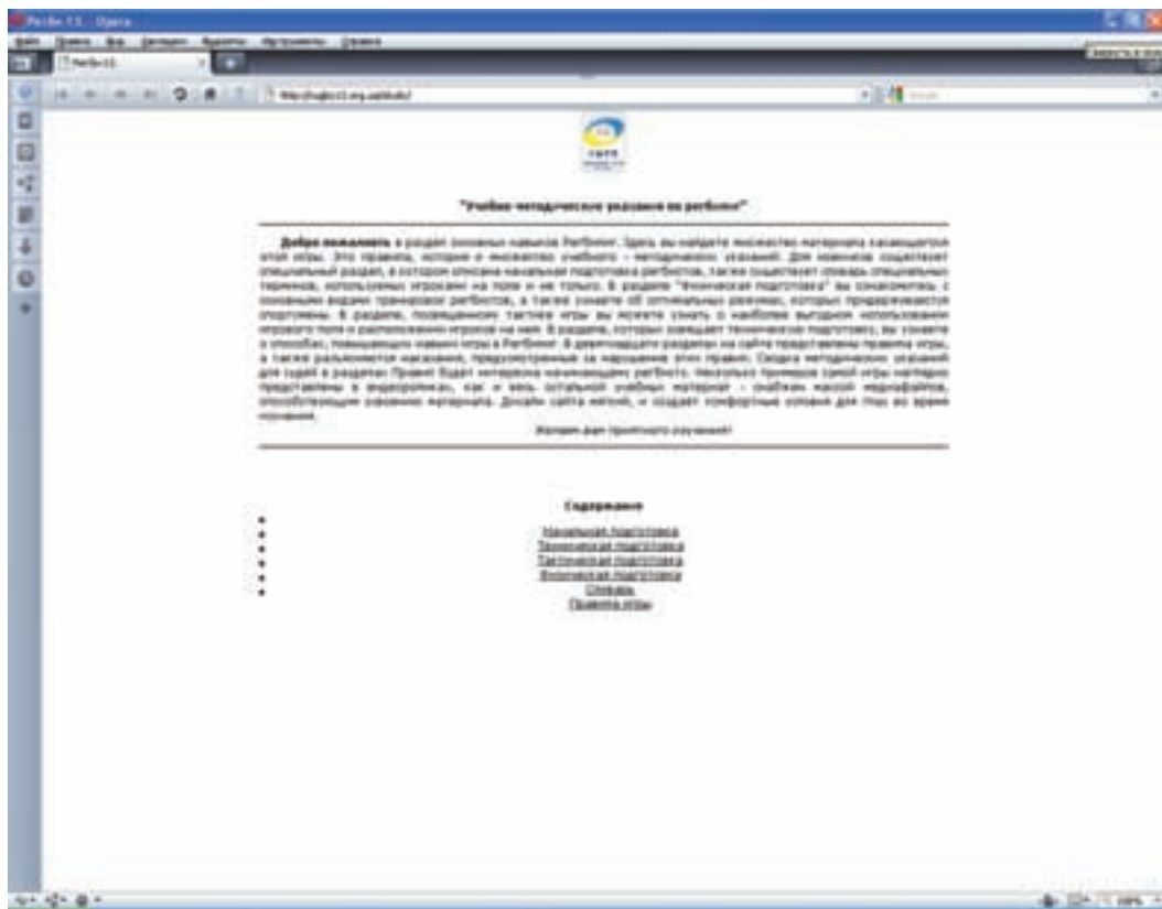
Рис. 1. Головне вікно програми

Подолька О. Б., Пасько В. В. НАВЧАЛЬНА КОМП'ЮТЕРНА ПРОГРАМА «РЕГБІ-13»: ДЛЯ ВДОСКОНАЛЕННЯ