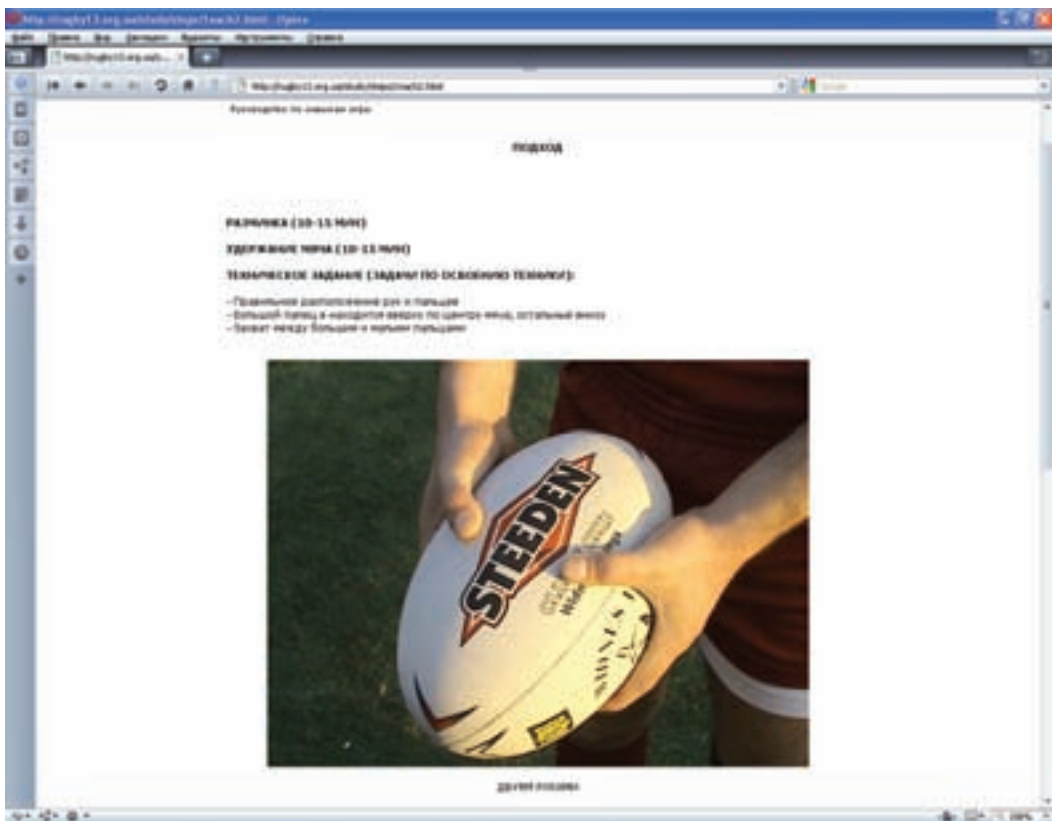
Рис. 3. Робоче вікно (навчальна підготовка)

мінів та правила гри, також пропонується обрати той вид підготовки, який потрібен фахівцю.