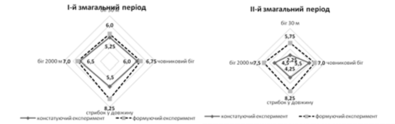
Рис. 3. Рівень фізичної підготовленості захисників у змагальних періодах на різних етапах експерименту

Подальші дослідження передбачається провести в напрямку вивчення інших проблем фізичної підготовки кваліфікованих хокеїсток.