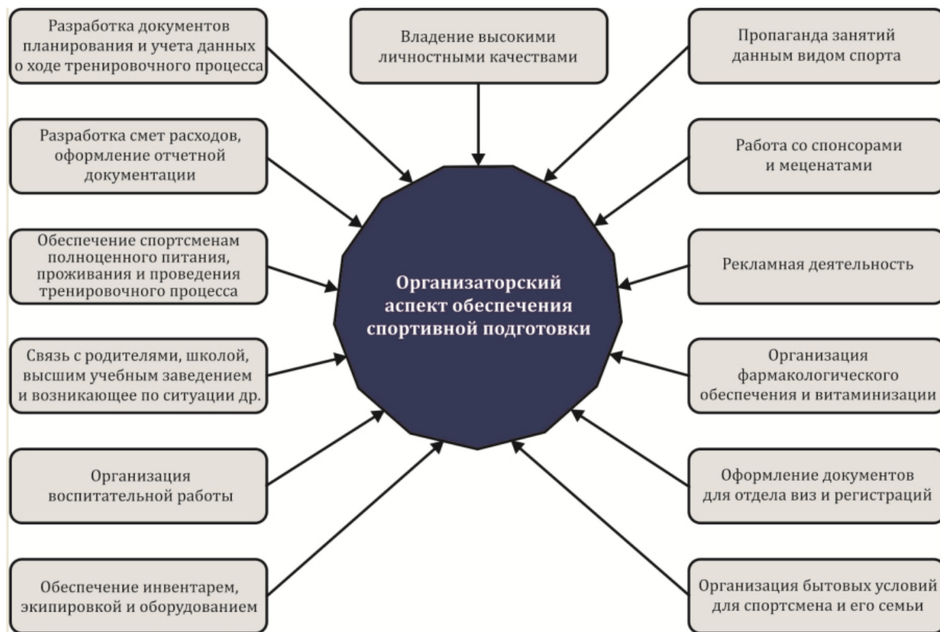
Рис. 2. Организаторский аспект подготовленности тренера по спорту