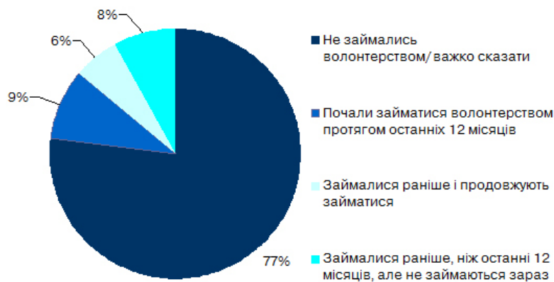
Рис. 1. Кількість тих, хто займається волонтерською діяльністю в Україні

Останнім часом поряд з соціальним волонтерським рухом активно розвивається спортивне волонтерство [2; 5]. Щороку в різних країнах світу проводяться міжнародні змагання найвищого рангу, які давно перетворилися на спортивні видовища і приваблюють мільйони вболівальників, кількість добровільних помічників на яких обчислюється десятками, а іноді й сотнями тисяч. Зокрема, на Іграх Олімпіад у 2000 і 2004 роках було залучено близько 50 тисяч волонтерів, 2008 року – близько 100 тисяч волонтерів, у Ванкувері в 2010 р. у якості волонтерів знаходилося 18 тис. 160 чоловік, при цьому 20% волонтерів приїхали з інших регіонів Канади або з-за кордону, на Іграх Олімпіади в Лондоні в 2012 році – понад 75 тисяч волонтерів [4]. За даними Організаційного комітету «Ріо-2016», на XXXI літні Олімпійські ігри, в яких приймали участь 10 899 спортсменів із 206 країн світу, було залучено близько 70 000 волонтерів, при цьому заявки надійшли в кількості 242 757 тисяч від представників 192 країн світу. Кількість добровільних помічників, які обслуговували Олімпійські ігри – 45 000 чоловік, а Паралімпійські ігри – 25 000 чоловік [10].