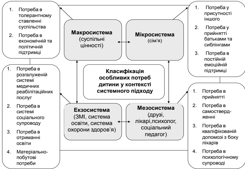
Рис. 2. Класифікація особливих потреб дитини в контексті системного підходу