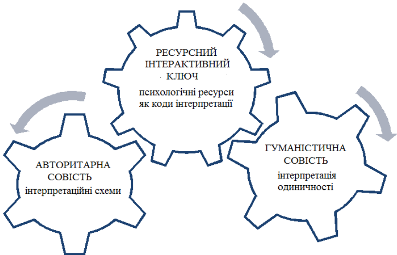
Рис. 2. Моральний і етичний виміри самоінтерпретування особи за допомогою ресурсного інтерактивного ключа

7. Інтерпретування людиною себе у контексті екзистенційної ситуації здійснюється завдяки її доступу до ресурсного інтерактивного ключа. Психологічні ресурси можна схарактеризувати як інтерпретаційні коди досягнення, отриманого людиною у її екзистенціальному досвіді. Доступ до ресурсного інтерактивного ключа зумовлений рівнем самопізнання та рішучістю керуватись гуманістичною совістю (рис. 2).