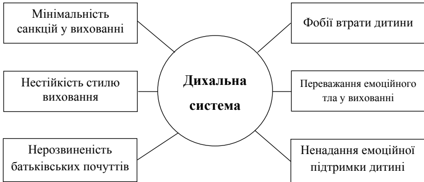
Рис. 1. Взаємозв'язок захворювань дихальної системи та сімейних стосунків

Для наочності отримані результати дослідження зв'язків захворюваності дихальної системи з принципами виховання у родині представимо графічно (рис. 1).