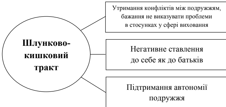
Рис. 2. Взаємозв'язок захворювань шлунково-кишкового тракту дитини та сімейних стосунків

Проілюструємо зв'язок захворюваності ШКТ дитини із сімейними відносинами графічно (рис. 2).