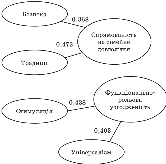
Рис. 2. Взаємозв'язок ціннісних орієнтацій із компонентами психологічного здоров'я сім'ї

Встановлено взаємозв'язок ціннісних орієнтацій із компонентами психологічного здоров'я сім'ї. Результати кореляційного аналізу представлено на рис. 2.