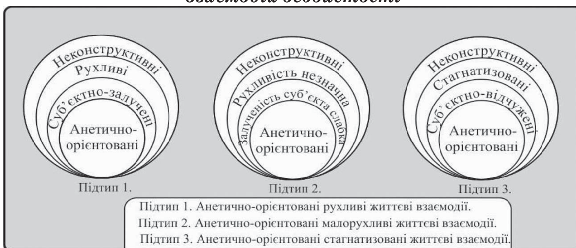
Рис. 3. Модель анетично-орієнтованого типу життєвих взаємодій особистості