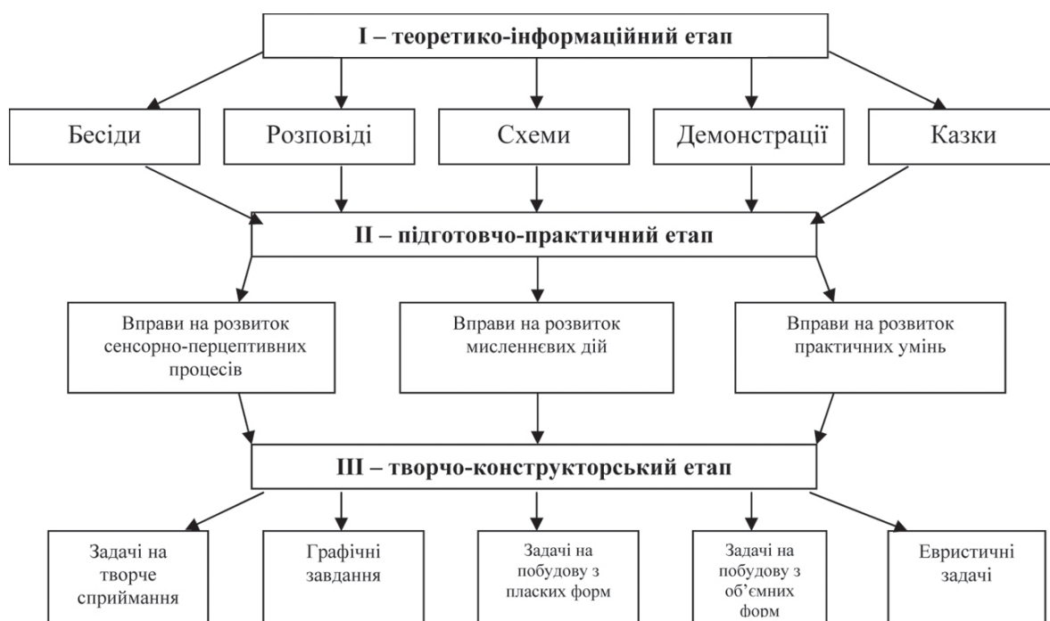
Рис. 1. Структура методики розвитку творчої діяльності дітей

Дітям пояснюють, що те, чого не дала людині природа, вона придумує сама (немає крил, не вмє літати – створила конструкцію і постійно її вдосконалює: аероплан, аеростат, гелікоптер, літак і т. ін.; не вмє плавати на великі відстані, не має плавників – створила кораблі; невисока – придумала підйомний кран тощо).