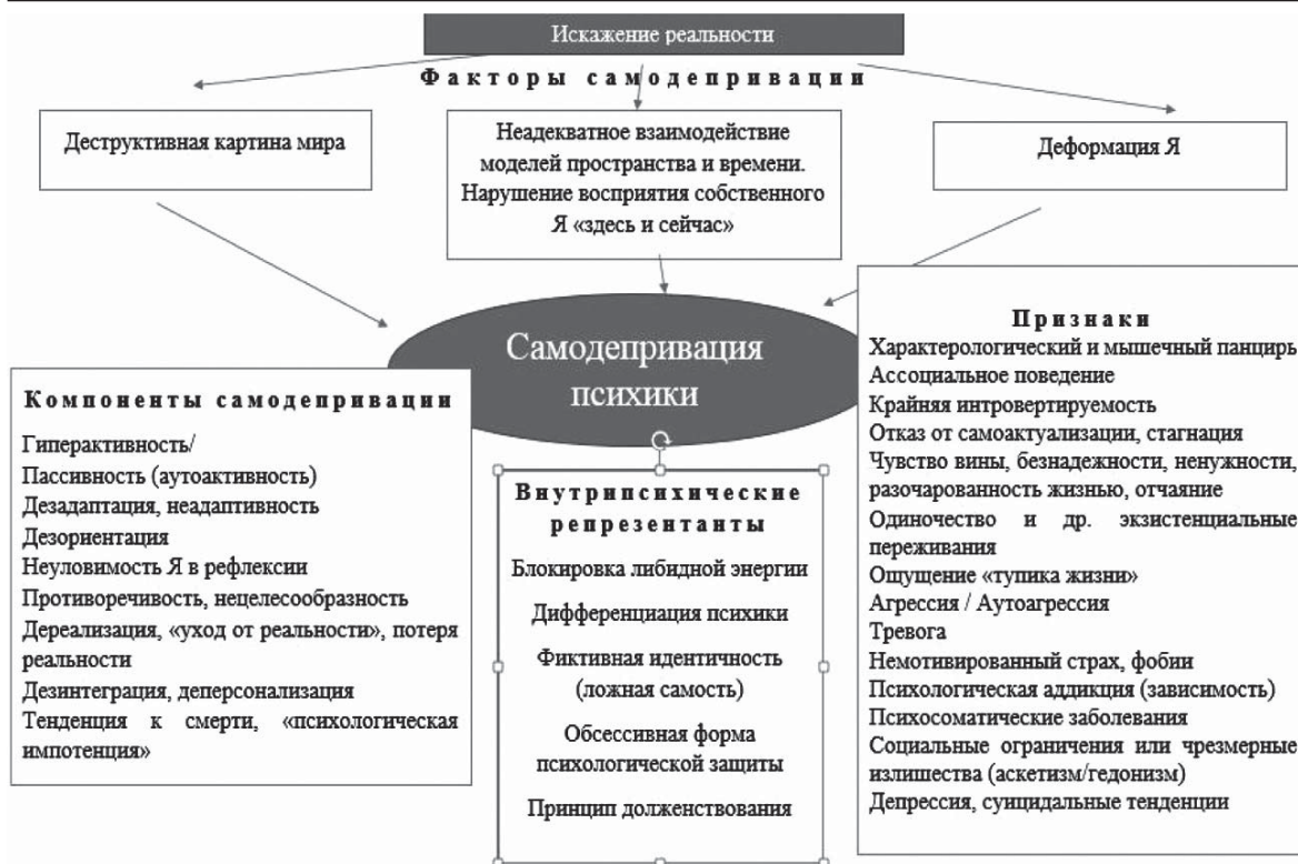
Рис. 2. Модель самодепривации психики субъекта

Теоретический анализ позволил выделить структурные компоненты самодепривации, раскрывающие содержание психологии самодепривации (см. рис. 2). Компоненты рассматриваются на поведенческом : гиперактивность/пассивность (аутоактивность); дезадаптация; дезориентация; нецелесообразность действий, дереализация; аффективном : дезинтеграция, деперсонализация; тенденция к смерти, к психологической импотенции» и рефлексивном уровнях: противоречивость, «уход от реальности», потеря реальности, неуловимость «Я» в рефлексии.